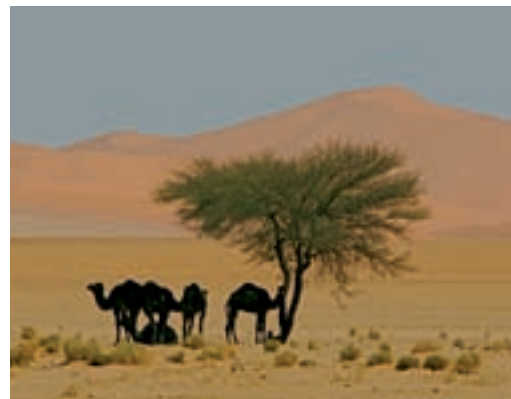
▲ Večerní idyla v poušti