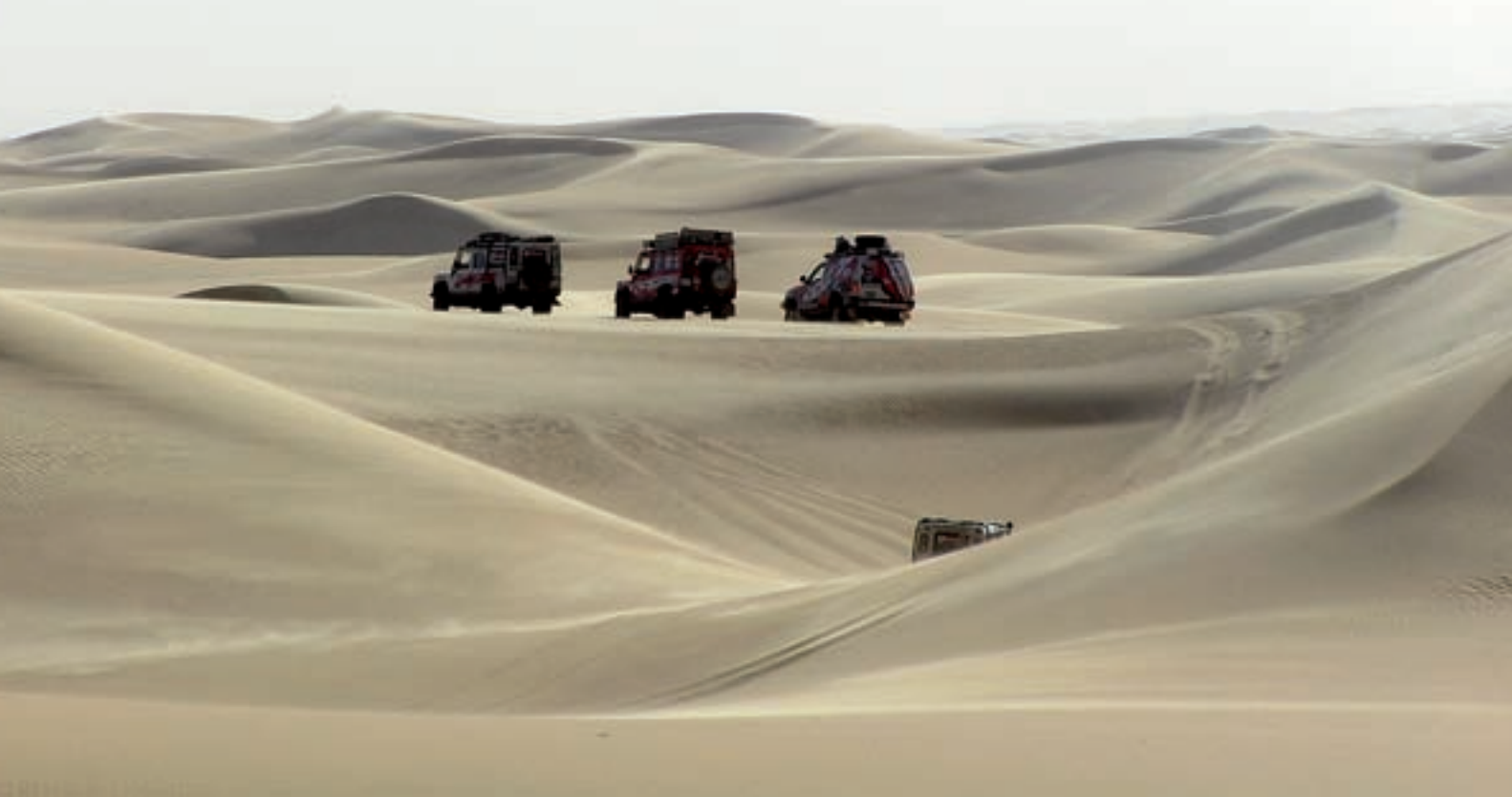
▲ Bílá Rebiánská poušť byla zase jiná