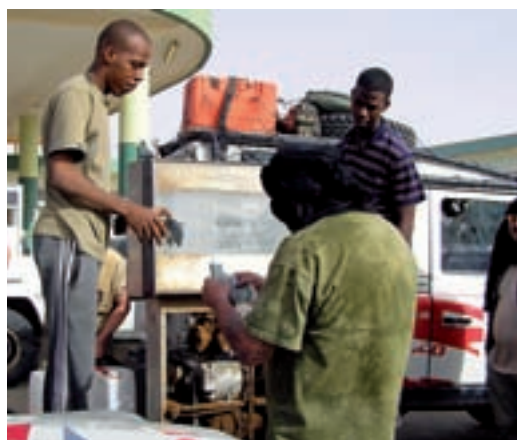
▶ „Šáš“ nesloužil pouze k ochraně obličeje proti slunci, ale hlavně jako respirátor