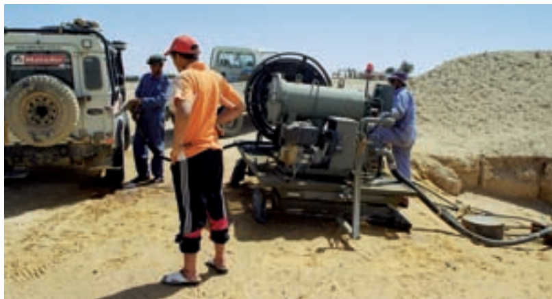
▲ Když si spravíte čerpadlo, můžete si natankovat