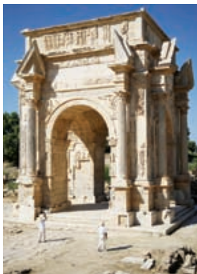
◀ Vstupní oblouk s freskami do římského města Leptis Magna bere dech

Západně od Tripolisu leží další římské město Sabratha, kde je největší zachovalý amfiteátr v Africe s krásnými mozaikami. Jeho průměr je 95 m a pokud se posadíte do hlediště, můžete obdivovat nejen zobrazení delfínů, ale také úžasnou akustiku.