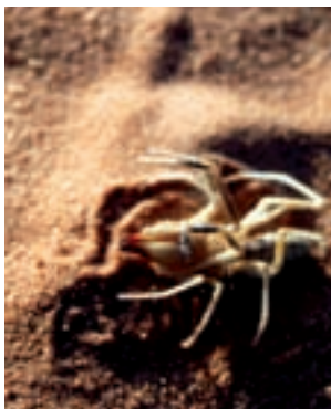
▲ Pavoukovec solifuga lovil tři dny v našem autě, aniž bychom o tom věděli