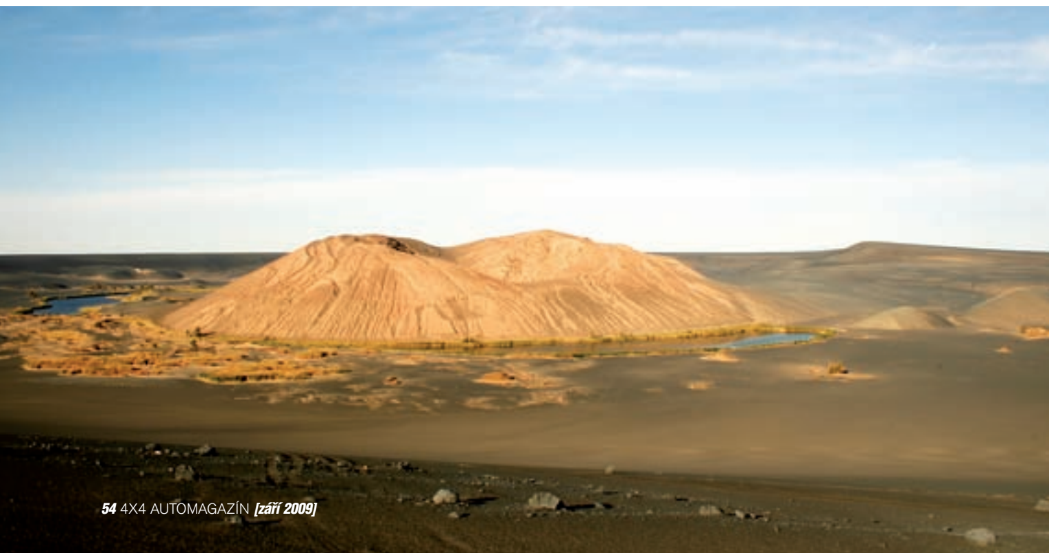
▼ Sopečný kráter Waw al Namus patří k jednomu z největších zážitků expedice