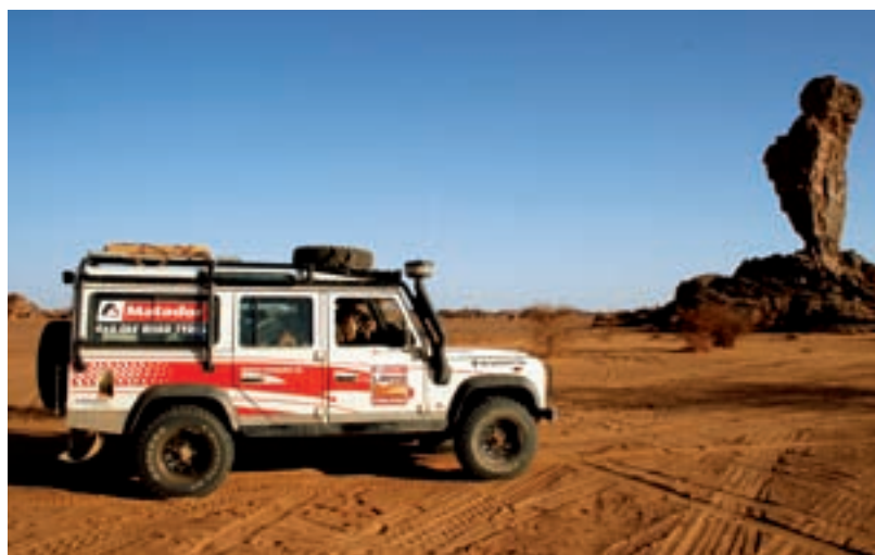
▼ Uhodli jste jméno skály? Místní ji nazývají těhotnou ženou, vztyčeným prstem nebo falusem pouště Akakusu

přírodnímu útvaru a 750 km dlouhá cesta hamadou, dunami, prašným černým popelem, ale hlavně extrémní roletou, při které odpadávaly přišroubované věci únavou materiálu, stála za to.